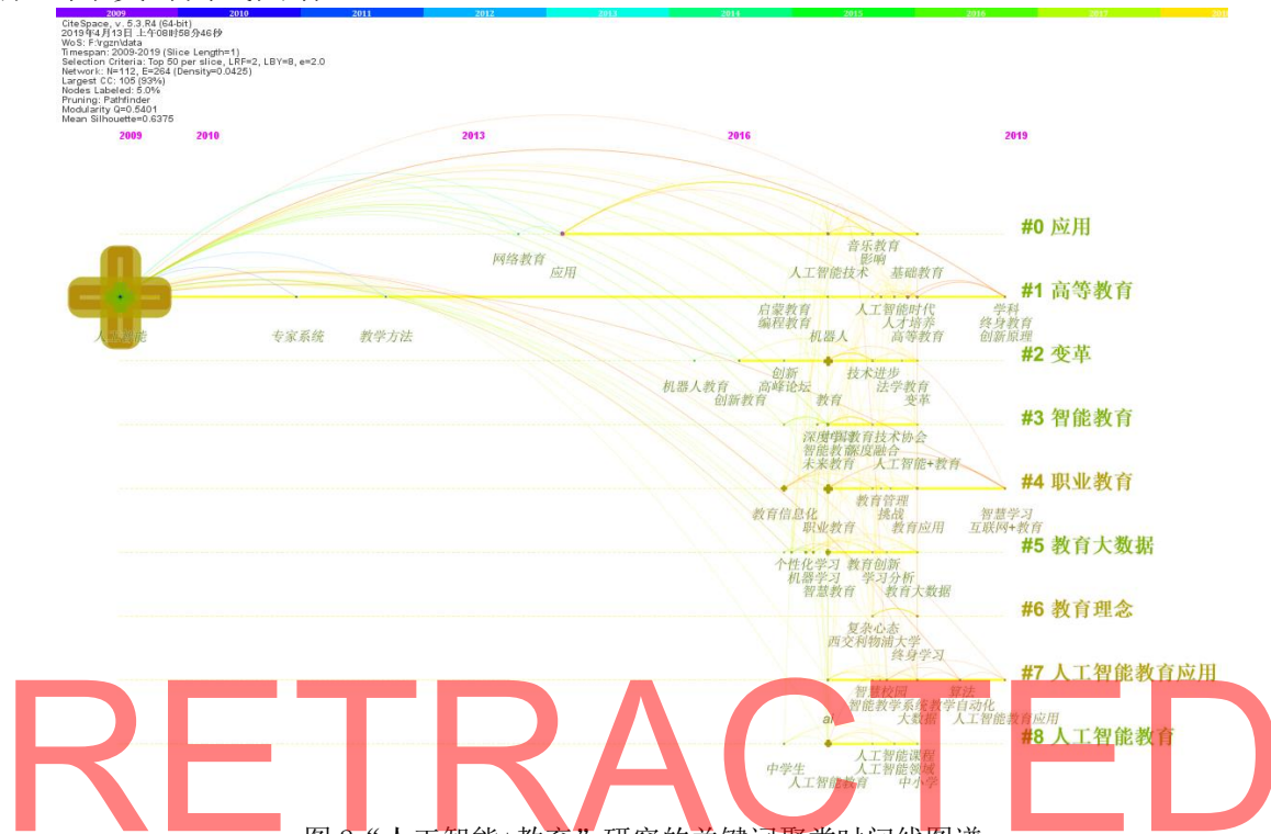
图 2 “人工智能+教育”研究的关键词聚类时间线图谱

对关键词知识图谱进行聚类并选择“timeline”可视化方式,产生图 2“人工智能+教育”研究的关键词聚类时间线图谱。