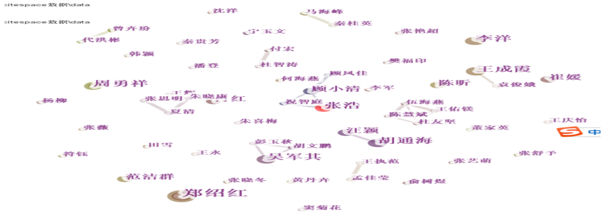
图2 研究者间的合作关系图谱

研究者并不多，仅占研究者总数的0.50%。此外，图2中列出了微型课程研究者合作图谱，从图中可以看出，各研究者之间合作并不紧密。