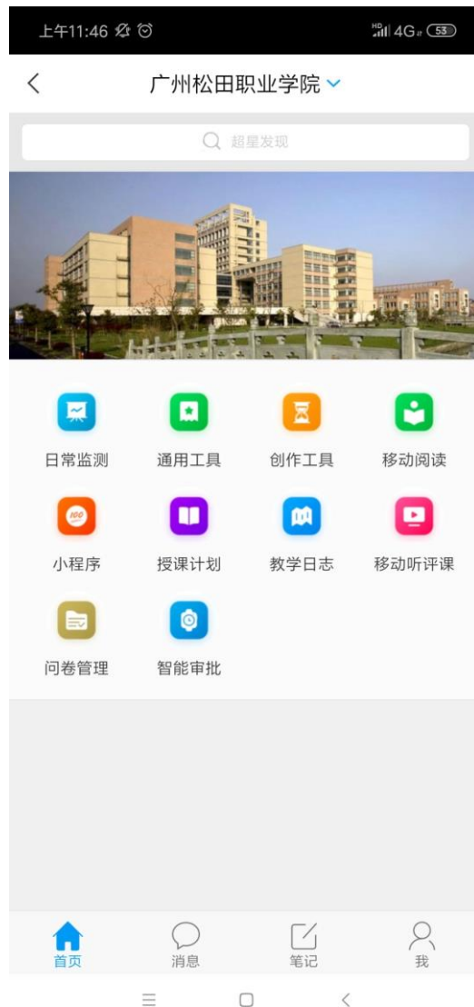
超星学习通操作界面表 3