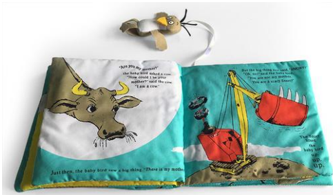
图6 布面书籍

现出三维的立体效果,在阅读使用结束后,仍可当作小型艺术品放置家中装饰。立体书籍充分利用儿童的好奇趣味心理,把普通的书本设计成一本具有互动性、趣味性的书籍。布面书籍同样如此,为防止儿童误食图书、撕毁书页,运用材料推翻纸质教材载体,利用布面形态和刺绣艺术结合在一起,设计出安全耐用的布面图书。孩子在布面书籍阅读中感受快乐的同时,也激发儿童的各种感官并增加儿童的想象力,让孩子体会艺术工艺的精妙之处。