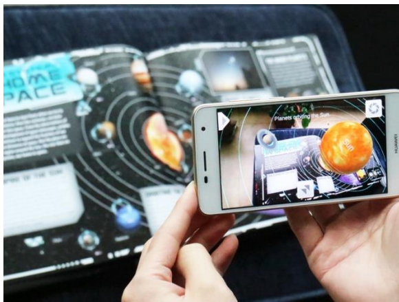
图7 AR书籍

这种印刷背后的审美艺术价值是普通教材教育价值之外的,使孩子潜移默化的提高阅读兴趣和审美水平。随着多媒体信息技术的发展,VR教学逐渐步入学生课堂,手机扫一扫就可以看见虚拟的实景教学。这种新技术的教学不仅节约印刷成本,学生在学习的过程中极大的激起学习兴趣。由此可见,图书印刷的载体不仅限于材料的肌理触感和立体结构的形态,慢慢向高科技、多维度延伸,新技术的开发对于教育行业的进一步改革亦是一个新的拓展与尝试。