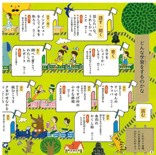
图3 日本教材目录

再如台湾的美感细胞教科书再造计划联合众多设计工作室共同设计教材,从小学到高中进行教材再设计。其中一本三年级自然教材,使用了大量手绘自然植物插图,设计师将不同颜色、形状、大小的叶子放在一个跨页中,透过观察发现不同叶子的差异,再引导学生认识植物的分类,除此之外,该课本还增加了许多让孩子动手画、动手触摸和感受的设计,以此方式增加孩子的记忆点和学习兴趣。整个自然课本以小男孩在森林中探索为动线,给学生极强的学习带入感,营造出沉浸式学习的氛围。