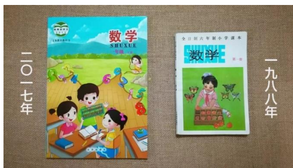
图1 教材形态对比图

学习积极性，往往表现出自制力差、学习时间短、好奇心强等特点。因此普通形态的幼儿教材难以吸引幼儿学生主动学习，在长时间的阅读体验上易造成学习教授过程中的枯燥无味，降低幼儿学习阅读兴趣，不易营造出隅学于乐的体验氛围，常常被动地接受教师的知识灌输。此外幼儿教材形态的设计过程中受到决策者等外在客观因素影响，使得教材的形态外观造型设计得到限制。