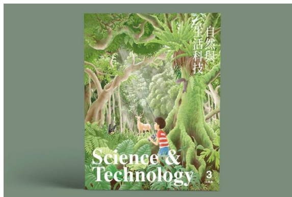
图4 台湾自然教材封面

再如台湾的美感细胞教科书再造计划联合众多设计工作室共同设计教材,从小学到高中进行教材再设计。其中一本三年级自然教材,使用了大量手绘自然植物插图,设计师将不同颜色、形状、大小的叶子放在一个跨页中,透过观察发现不同叶子的差异,再引导学生认识植物的分类,除此之外,该课本还增加了许多让孩子动手画、动手触摸和感受的设计,以此方式增加孩子的记忆点和学习兴趣。整个自然课本以小男孩在森林中探索为动线,给学生极强的学习带入感,营造出沉浸式学习的氛围。