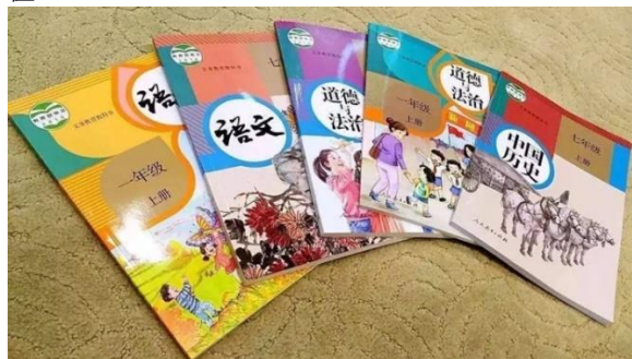
图2 小学教材封面设计

教材的视觉艺术美感培育至关重要，社会主义教育的教育层面不止是素质教育，美育教育也是新时代下的社会主义教育的重要部分。目前市面上的幼儿教材基本停留在知识教育意义的层面，依然存在教材封面设计缺乏美感、插图绘制粗糙老旧、排版设计混乱等问题，教材不仅仅是满足教材的实用教学功能，也应该注重学生的艺术熏陶和艺术教育的审美体验，给学生提供更多的视觉美感和艺术价值。