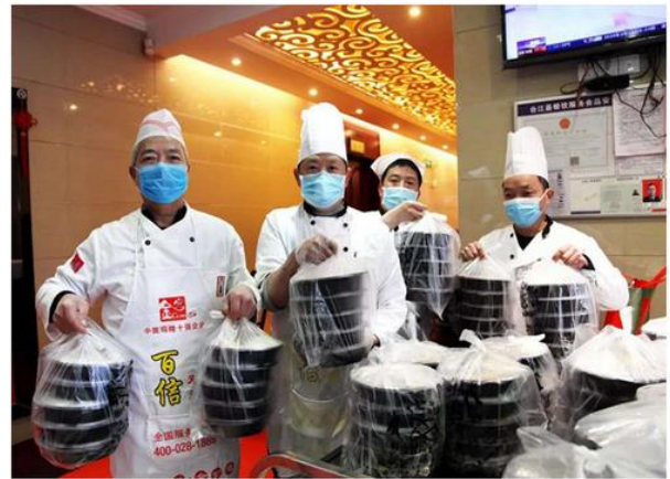
图 6 餐饮企业防疫工作效果良好

风险应对方案落实到企业后，还要针对实施该风险应对方案得到的风险管理效果进行评价，对风险管理效果的评价的优化主要有两步，一是实现管理效果的量化体现，通过管理效果的量化得到方案实施所获成果的总体水平，以确定后期企业方案应该持续实施还是需要总体调整。二是总结呈现管控经验，为后续方案完善进而提高疫情下企业的风险应对能力打下基础，学习初期的方案实施过程中出现的益处和弊端，在后期坚持其益处，摒弃其弊端。