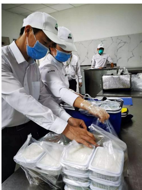
图 3 疫情期间餐饮企业外卖经营