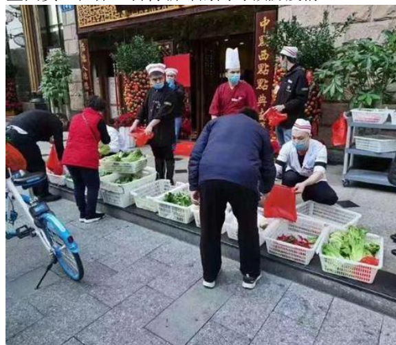
图 4 疫情期间餐饮企业销售原材料

间的消费者所需要用到的食材, 而突如其来的疫情让春节期间的餐饮企业门可罗雀, 大量囤积的原料无用武之地, 不少餐饮企业只能将原料再次倒卖出去, 这些原料, 不仅没能为企业创造价值, 反而造成了企业的经济损失, 而更多的餐饮企业, 由于消费者不外出消费及缺少原材料消费渠道等原因, 没能将原料再次倒卖出去, 最后只能通过其他方式处理掉。故而做好疫前预防工作, 线下餐饮企业要适量采购原材料, 少量采购市场小的原材料, 拒绝大量囤货, 在保证食材新鲜的同时预防疫情。