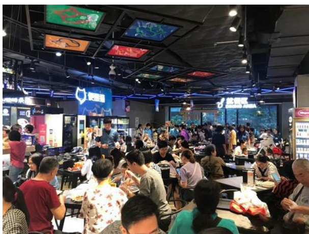
图 2 消费者在餐厅就餐