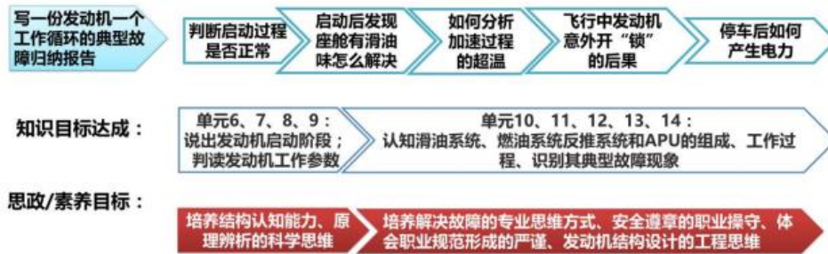
模块二的教学内容组织和课程思政融入载体设计