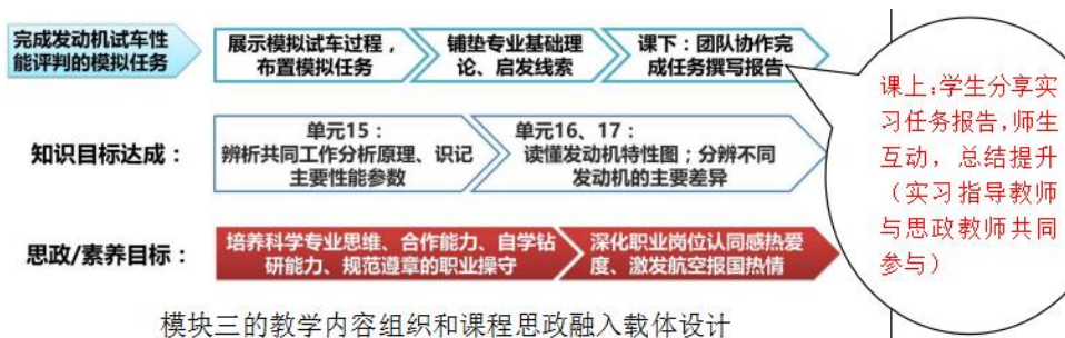
图4 模块三的教学内容组织和课程思政融入载体设计