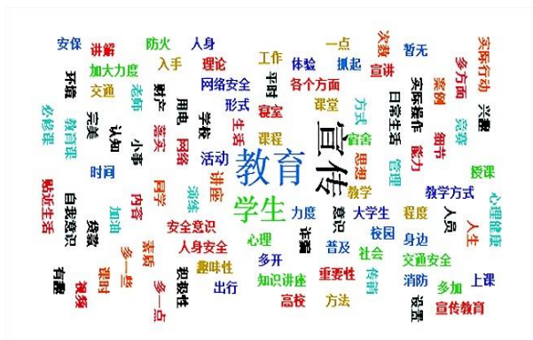
图6 大学生安全教育关注点词云

通过调查结果与词频分析，学生认为高校应该从安全教育本身、安全教育宣传和安全教育主体三个方面进一步改善大学生安全教育教学。