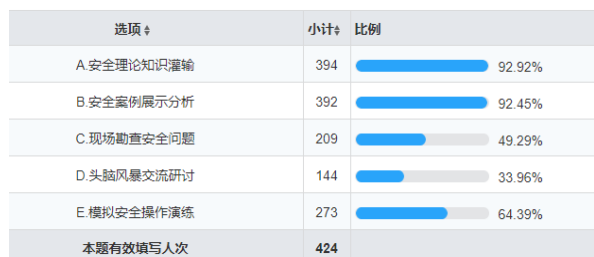
图5 学校开展安全教育活动的形式