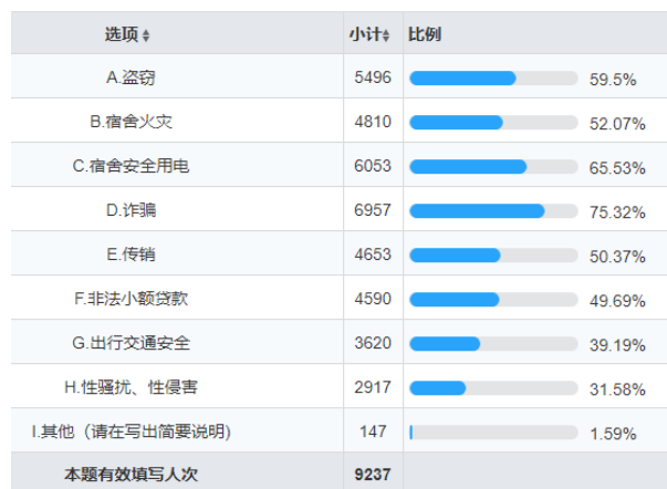
图 2 大学生最容易遭受的安全威胁