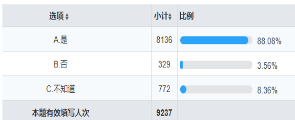
图3 除安全教育课外，学生在校期间参加的安全教育活动的次数