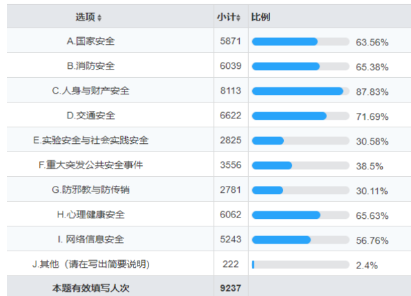
图 1 大学学习和生活中经常遇到的或经常关注的的安全问题

根据问卷调查的结果，如图 1、2 所示，综合现有文献的归纳，结合访谈，本文认为和大学生日常校园学习生活联系较为紧密的安全问题主要有：人身与财产安全、交通安全、生活与交往安全、心理健康安全、信息与网络安全等。