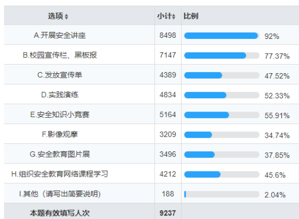
图4 学校开展安全教育活动的形式