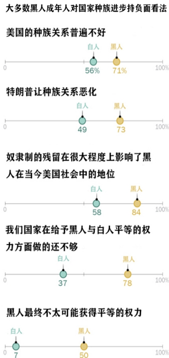
图 1 黑人成年人对国家种族进步的看法

数据来源：(Race in America 2019, https://www.pewresearch.org/social-trends/2019/04/09/race-in-america-2019/ , Accessed 25 May. 2021)