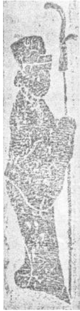
图2 执戟戟门吏（《河南南阳英庄汉画像石墓》）

其次是乐舞百戏内容。其中最为突出的是建鼓舞。由于画像石表现范围的局限，建鼓舞很可能是指代了整个乐队。还有少数墓葬表现了更全面的乐队组成，如南阳陈棚墓、南阳王寨墓、辛店熊营墓。另一种非常重要的内容为角觥戏，有二人相斗、人兽斗、兽斗等形式。表现乐舞百戏的画像大多数被布置在墓室之内的门楣（包括墓门门楣背面，从意义上也是属于墓室内部的一部分）、梁上，也就是居室的“室内”，墓主人“生活”的地方。乐舞百戏是墓主人在世时进行的娱乐活动，墓葬的设计者将其布置在墓室之内，希望墓主人在自己地下世界的宅第中能够继续享受这些娱乐活动。除了乐舞百戏，还有六博等娱乐活动，也被布置在了墓室之中。（图3）