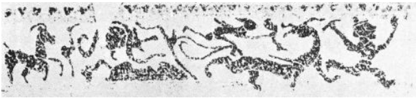
图5 山海神灵图(《南阳县王寨汉画像石墓》)

天象图布置于墓顶或是横梁的下面,都是位于墓室之内顶面的,正是仿拟了现实世界中日月星辰的位置而刻画的。