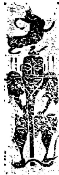
图4 材官蹶张（《唐河县针织厂二号汉画像石墓》）

蹶张、执钺神人与驱邪兽类的作用相同。主要分布在墓门门扉、门柱、墓室立柱之上。（图4）