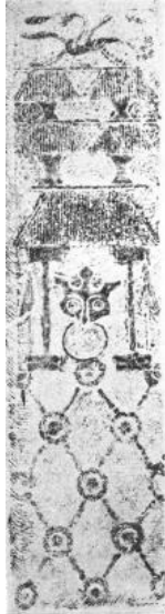
图1 楼阁（《南阳县赵寨砖瓦厂汉画像石墓》）

墓门装饰的菱形图案，常出现在汉代的房屋在门窗上，或称为绮寮。 [1] 菱形格也往往与环形贯连，或称为琐文。 [2] 从早期菱形格布置的位置来看，这种图案的设置显然是为了模拟住宅的门窗形式。因此这种设置的目的，也是符合墓葬发展宅第化的趋势的。（图1）