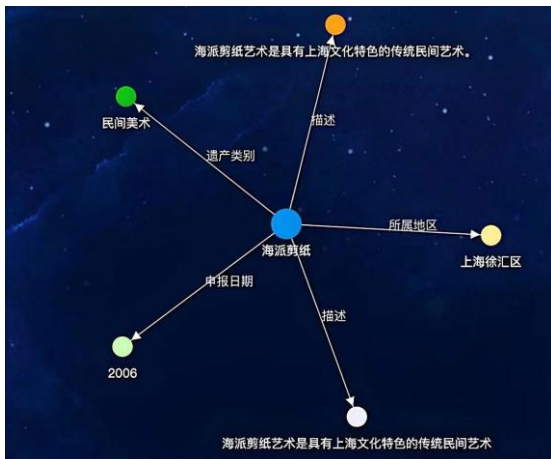
图3 “海派剪纸”关联知识图谱

目前，“海派剪纸”可以看作上海徐汇区独特的文化符号。基于数据分析，以“海派剪纸”为关键词进行检索，会发现与其相关联的词语，如图3。上海徐汇区为其中一项关联词，说明该区域对于海派剪纸的保护具有一定规模，且大众对其已经产生认知度。可以认为，隶属该区域的枫林街道作为“海派剪纸”的传承社区，起到了举足轻重的作用。