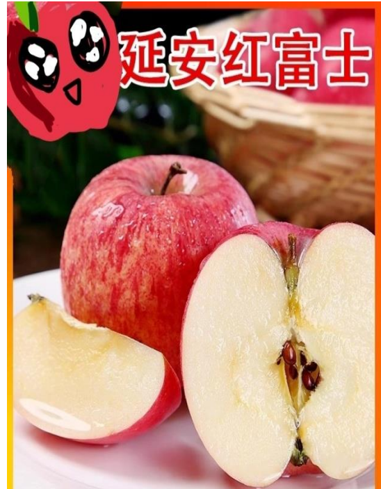
图 2 融入思政教育的课程实践