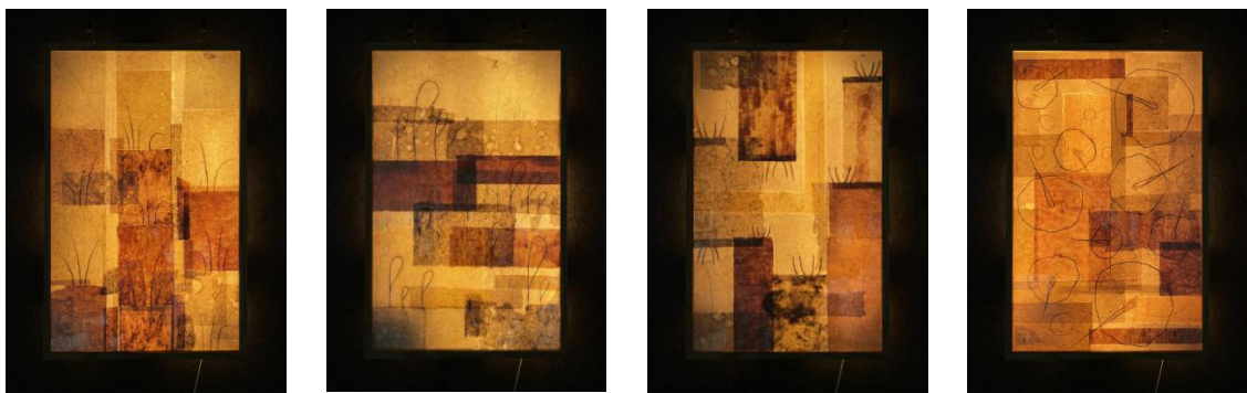
图 4 创作实践“归园田居”