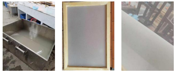
图1 实验室造纸过程（制浆、抄纸、揭纸）