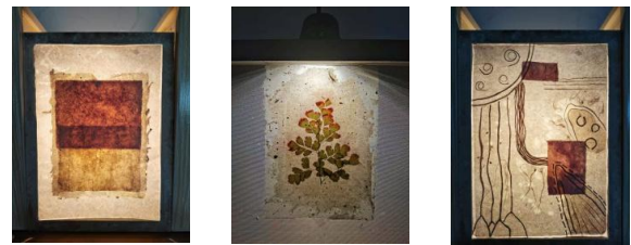
图 3 纸张光呈现试验

更为重要的是作品表现的归园之心走向了现代人的反方向，但却是对人之本心的回归，归于最初的归园者的朴实与醇厚。手工造纸艺术化人们的生活，作为一种手工艺体验，人们可以感受到现代社会繁荣以外的自然和惬意；手工造纸也使生活充满艺术感，作为装饰或是灯光可以为人们的栖息之所营造出宁静柔和的气氛。